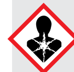
опасность для здоровья

Вещества, причиняющие указанный вред здоровью. Примеры: соляная кислота, гидроксид натрия, плавиковая кислота.