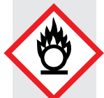
пламя над окружающей средой

Взрывчатые вещества, смеси и предметы, в том числе — произведённые для создания практического взрывного или пиротехнического эффекта. Под взрывчатыми понимаются вещества, способные к химической реакции с выделением газов при такой температуре и давлении и с такой скоростью, что это вызывает повреждение окружающих предметов. Примеры: тринитротолуол, пикриновая кислота.