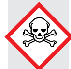
череп и кости

Химические вещества, вызывающие смертельный исход при проглатывании, вдыхании или впитывании через кожу. Примеры: плавиковая кислота, бром, синильная кислота.